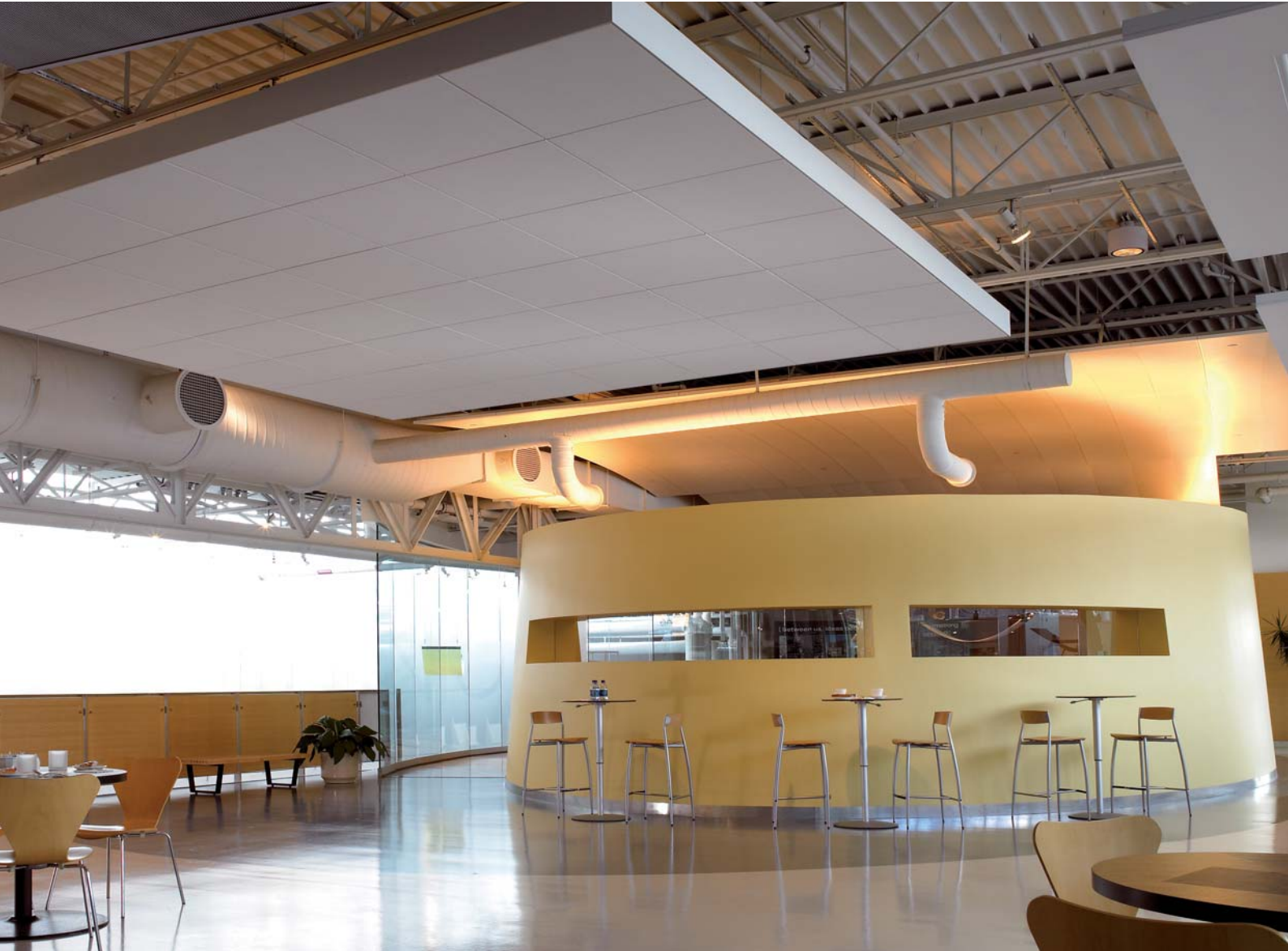
Ultima Vector & Axiom Canopy